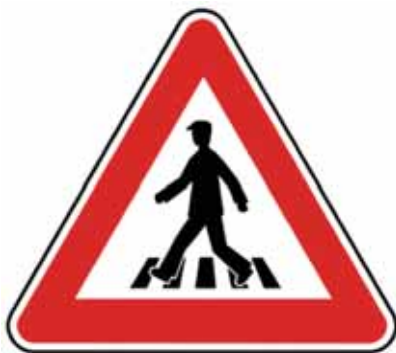
Priechod pre chodcov