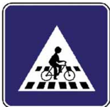
Priechod pre cyklistov