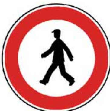
Zákaz vstupu chodcov