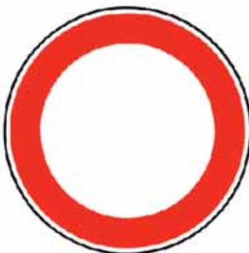
Zákaz vjazdu všetkých vozidiel (v oboch smeroch)