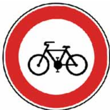
Zákaz vjazdu bicyklov