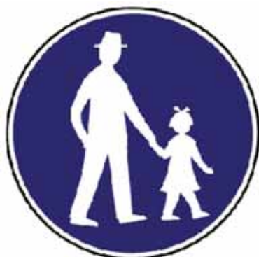
Cesta pre chodcov