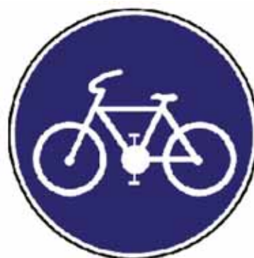
Cesta pre cyklistov