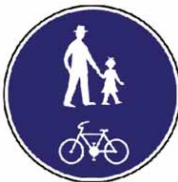
Cesta pre chodcov a cyklistov