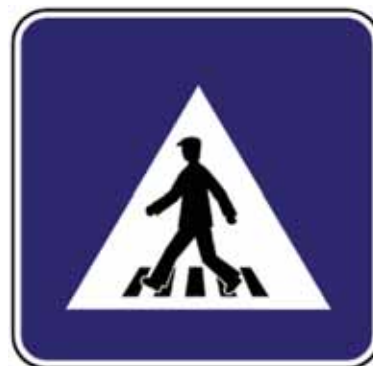
Priechod pre chodcov