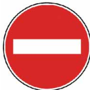
Zákaz vjazdu všetkých vozidiel